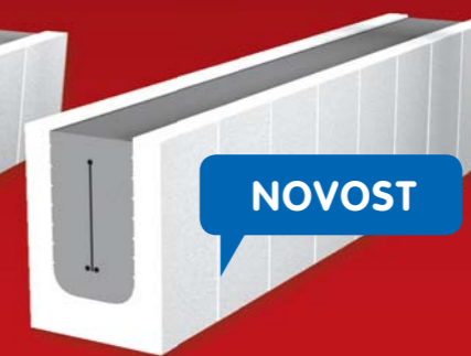
SENDWIX PREKLADA 6DF 175x240x1000-3000