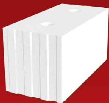
SENDWIX 16DF-LD 498x240x248