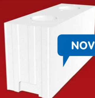
SENDWIX 12DF-LD 498x175x248