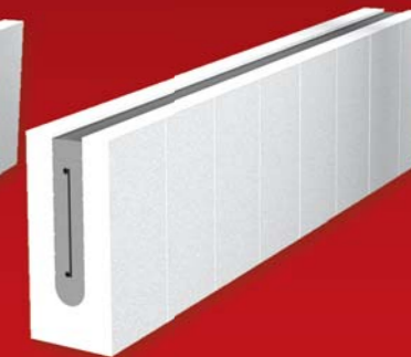
SENDWIX PREKLADA 2DF 115x240x1000-3000