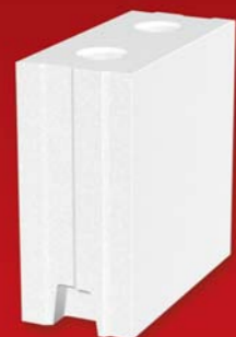
SENDWIX 4DF-LD 248x115x248