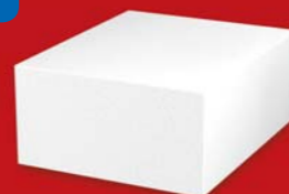
SENDWIX 5DF-LP 290x240x123