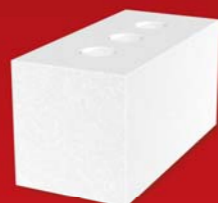
SENDWIX 2DF-LD 240x115x123