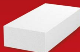
Zgornja opeka VF 290x140x65