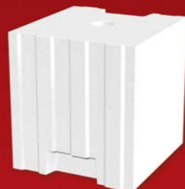
SENDWIX 8DF-LD 248x240x248