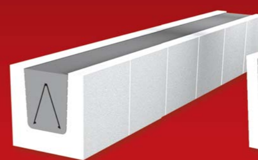
SENDWIX PREKLADA 8DF 240x240x1000-3000